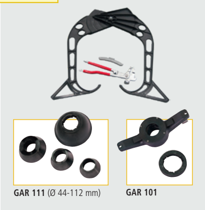
GAR 111 (Ø 44-112 mm)